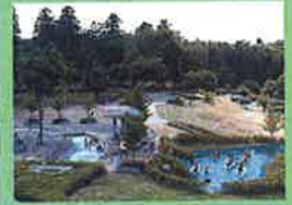
宮山ふるさとふれあい公園